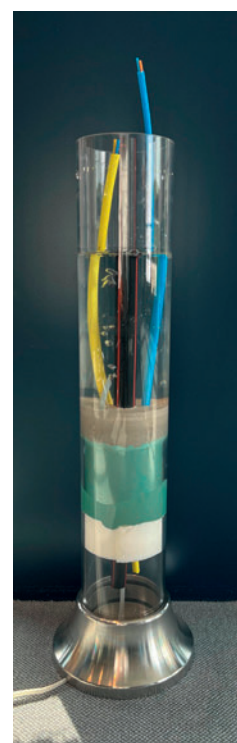
Anstehende Wassersäule - seit 17 Jahren dicht